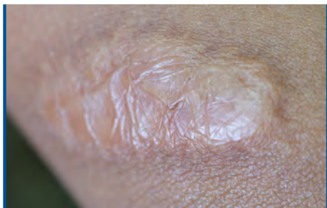
Prevenzione e trattamento delle cicatrici atrofiche, ipertrofiche e cheloidee