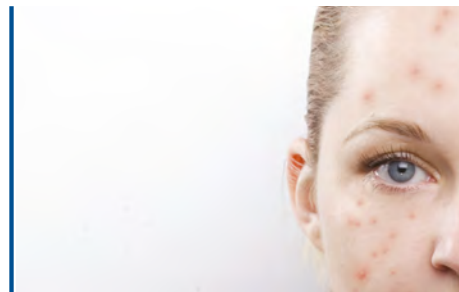
Trattamento delle cicatrici da acne e delle smagliature