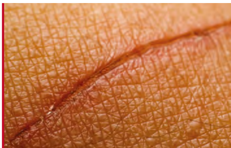
Trattamento degli esiti cicatriziali da ustioni